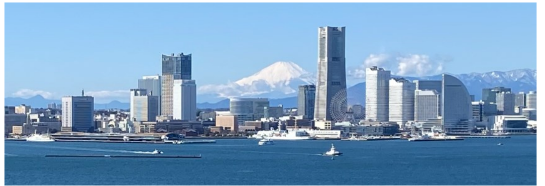
100年前の横浜は、関東大震災で壊滅した被災地だった・・・