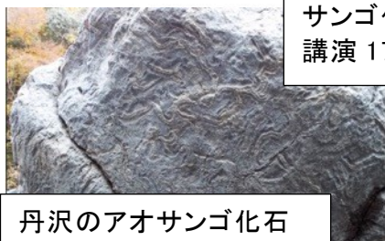
丹沢のアオサンゴ化石

耐震補強実験模型、微動計、救出ボックス、アイデア防災グッズ、防災ドローン等実物展示 触れる、実験する、体験できるものもあり